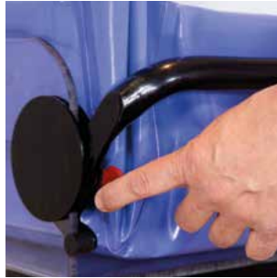
Opération barrière latérale.