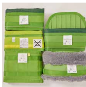
Toujours la sangle adéquate.