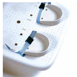
En option : soutien de talon.