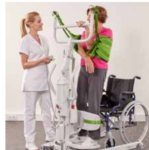
Sangle Confort avec étrier Confort. (Art.no. 2202027003).