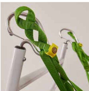
marquage de sécurité.