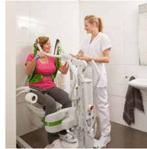
Sangle de rehaussement Sabina avec étrier 350 (Art.nr. 2202027002). Pour se lever en toute simplicité.