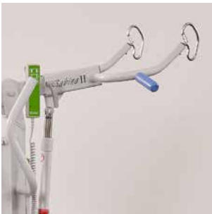
Sangle Sécurité avec étrier 350.