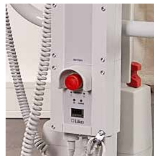
Bouton d'arrêt d'urgence.