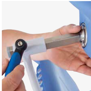
La hauteur et la profondeur des appui-tête / nuque sont faciles à régler.