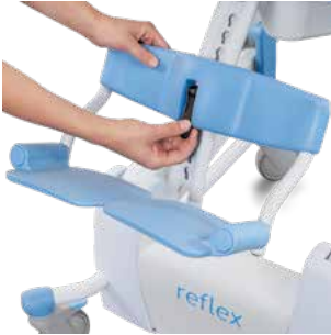
Repose-pieds et protège-mollets amovibles et à hauteur réglable.

Convient pour des personnes présentant un handicap moyen à très grave