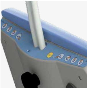
Utilisation simple grâce aux touches de commande intégrées au dossier.