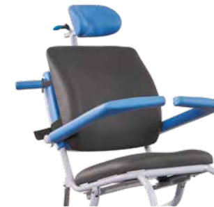
Option: Article n° 6950 5624 et 6950 5625 Dossier et siège Platon.