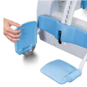
Repose-pieds rabattable et amovibles.