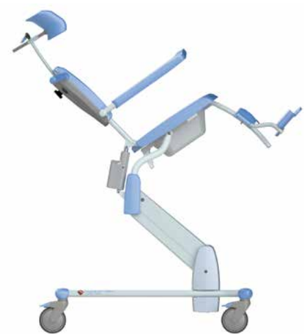
La position la plus basse à la position la plus haute et réglage d'inclinaison de 30 degrés.